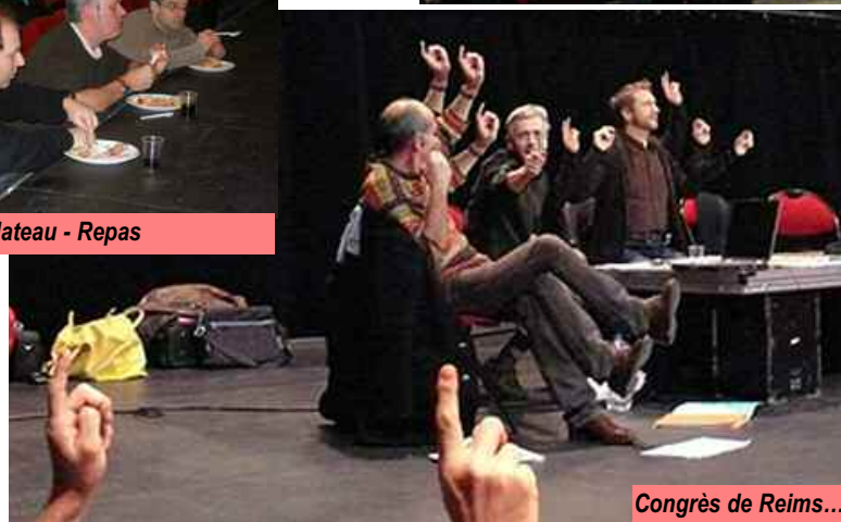
Congrès de Reims...