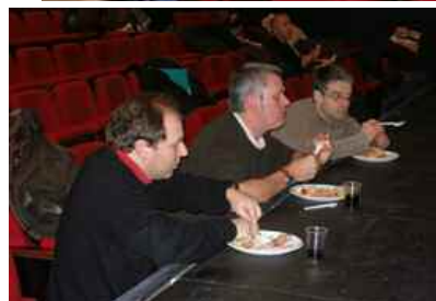
Plateau - Repas