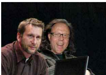
Passation de pouvoir...